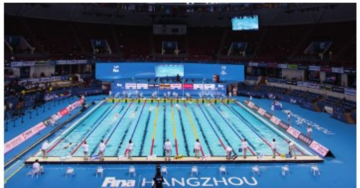
Hangzhou, China 2018 FINA WORLD SWIMMING CHAMPIONSHIPS (25m)