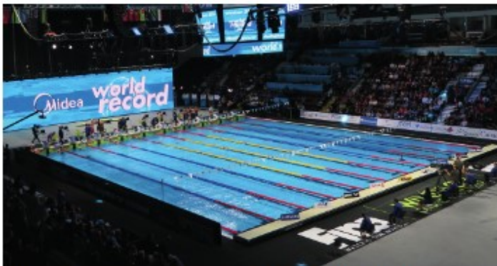
Windsor, Canada 2016 FINA WORLD SWIMMING CHAMPIONSHIPS (25m)